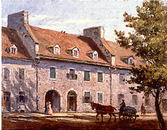
Maison de sir George-Étienne Cartier après 1818 Georges Delfosse (1869-1939)