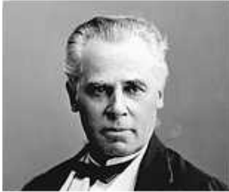
Sir George-Étienne Cartier © Musée McCord / William Notman Archives photographiques Notman, I-67119

Lieu où vécu le personnage politique le plus influent du Bas-Canada